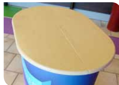
ET Comptoir d'accueil Tablette en plaqué hêtre incluse