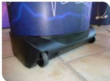
Valise de transport à roulettes